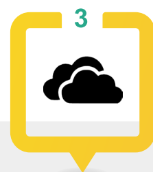
OneDrive for Business